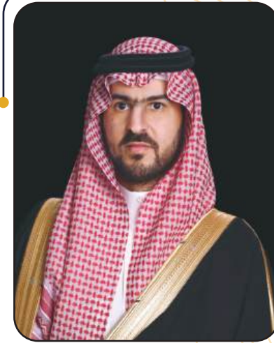
صاحب السمو الملكي

الأمير سعود بن نايف بن عبد العزيز آل سعود أمير المنطقة الشرقية