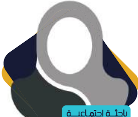
باحثة إجتماعية نقوى سعد علي المطر