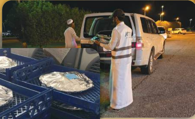
توزيع وجبة عشاء العيد للمستفيدين من مشروع #فرحة_عيد للايتام لادخال السرور على الأسر في يوم #عيد_الأضحى_المبارك