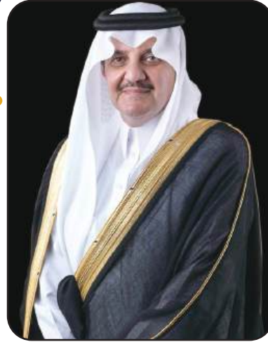
صاحب السمو الملكي

الأمير سعود بن طلال بن بدر بن سعود آل سعود محافظ الأحساء