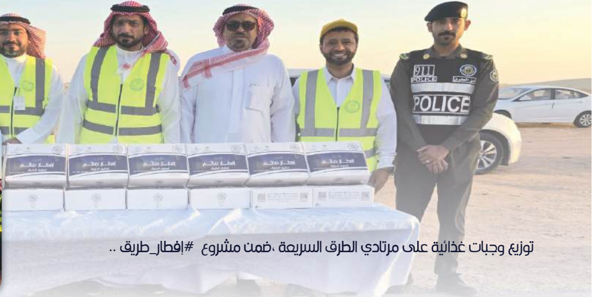
توزيع وجبات غذائية على مرتادي الطرق السريعة، ضمن مشروع #إفطار_طريق ..