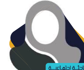
باحثة إجتماعية وضحة سالم سعيد الحويل